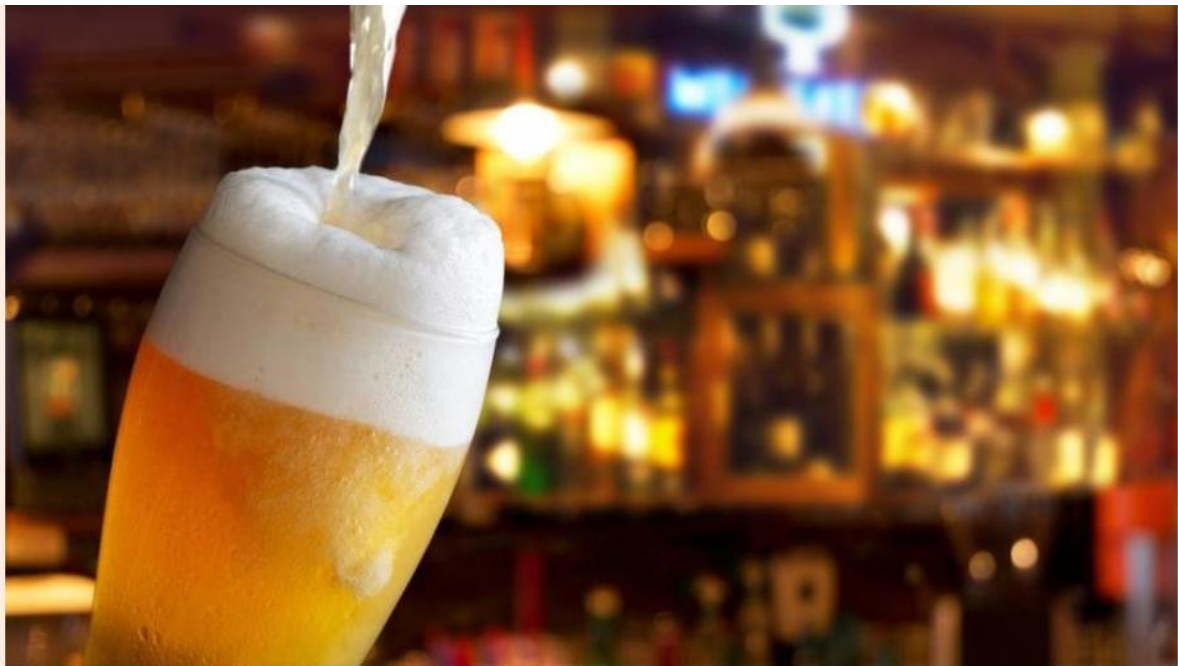
Bodo višje trošarine dvignile tudi končno ceno piva?

S 1. junijem se trošarine na pivo dvigujejo za sedem odstotkov. Pivovarji opozarjajo, da imajo naši sosedi precej nižje trošarine. Če bo prodaja slovenskega piva upadla, država v proračun nikakor ne bo dobila pričakovanih pet milijonov evrov.